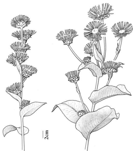
Figuur 1. Bloeiwijze van Inula racemosa (trosvormig; links) en I. helenium (tuilvormig; rechts).

van Marke nabij Kortrijk. De soort bleek ont-snapt uit een verwaarloosde tuin. In juni 2005 werd op dezelfde locatie een forse uitbreiding vastgesteld, met tientallen exemplaren, verspreid over twee kilometerhokken. Tot dan werden de planten nooit in bloei aangetroffen zodat aangenomen werd dat het Inula helenium was. Begin december 2006 werden op een nabijgelegen oude stortplaats in Rollegem enkele exemplaren aangetroffen van een Inula met duidelijk afwijkende bloeiwijze. Determinatie met Akeroyd et al. (2000) leidde ondubbelzinnig tot I. racemosa .